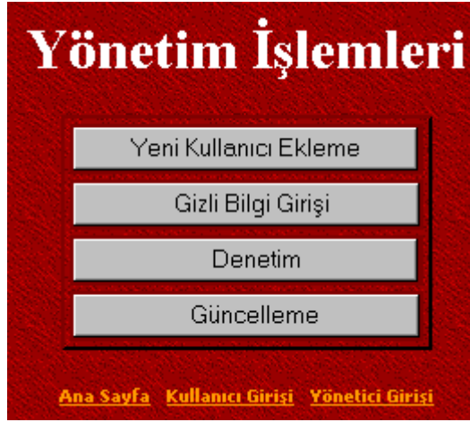
Şekil 2. Yönetim İşlemleri Bölümü

Denetim Bölümü, konut tahsisine başvuran kişiler hakkında yapılan ihbarların değerlendirilmesini yapmaktadır. Daha önce özel bilgiler dışında programa giriş yapan kullanıcının tüm bilgilerinin diğer kullanıcılar tarafından görülüp, yanlış bilgi vermişse ihbar edilebileceğini söylemiştik. Bu kısımda yanlış bilgi beyanında bulunan kişilerin isim listesi gelmektedir. Program yöneticisi kişinin isminin bulunduğu linke tıkladığında kişi hakkında yapılan ihbarları görmektedir. Bundan sonra yönetici ihbarı silebilmekte veya “İşlem Yapıldı” düğmesine basarak işlem yapıldığını belirtebilmektedir.