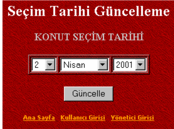
Şekil 3. Seçim Tarihi Güncelleme Bölümü

başvurmak zorundadırlar. Daha sonra gerekli değişiklikler, program yöneticisi tarafından bu bölüm kullanılarak yapılmaktadır.